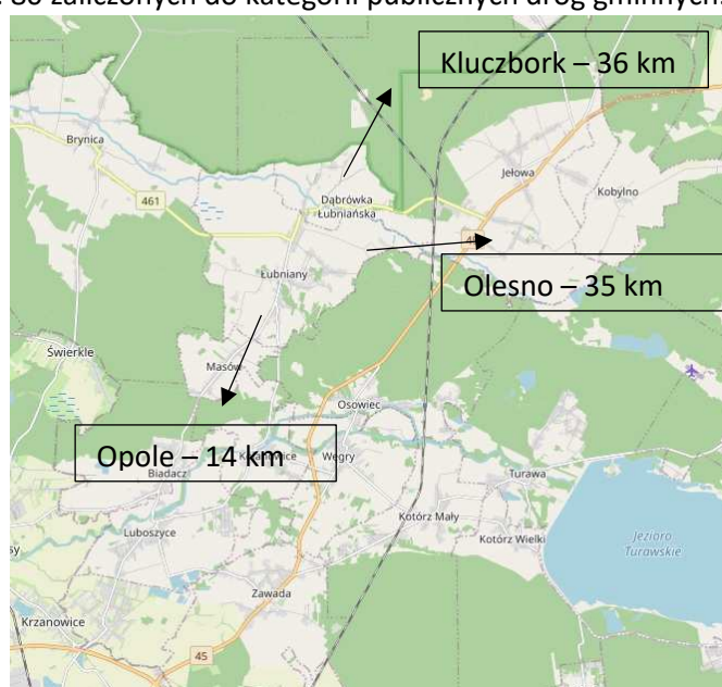
Rys. 3 Regionalny układ komunikacyjny w okolicach Łubnian