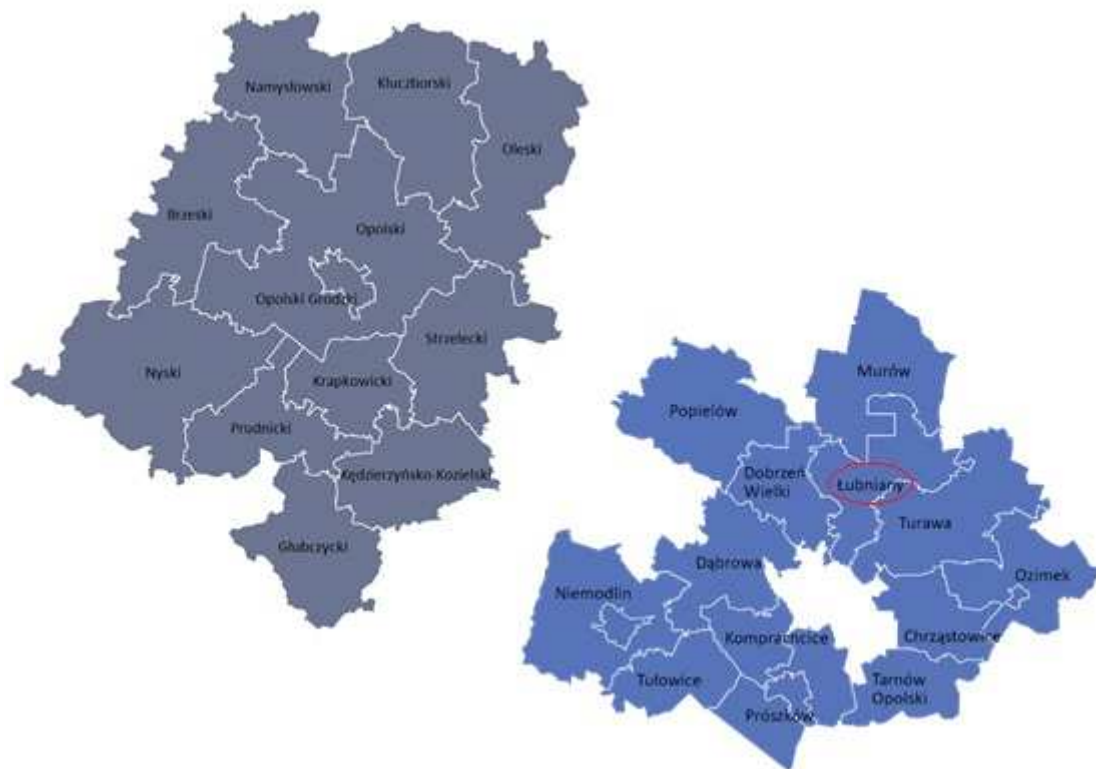
Rys.2 Lokalizacja gminy na terenie województwa opolskiego