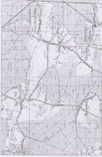
Współrzędne punktów załamania OG i TG "BRYNICA 2"